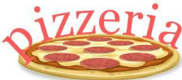
Obraz 1c. Logo pizzerii

Przy pomocy programu do obróbki grafiki wektorowej wykonaj logo zgodne z przedstawionym Obrazem 1c. Kolejne kroki wykonania logo przedstawiają obrazy 1a – 1c. Wymagania: