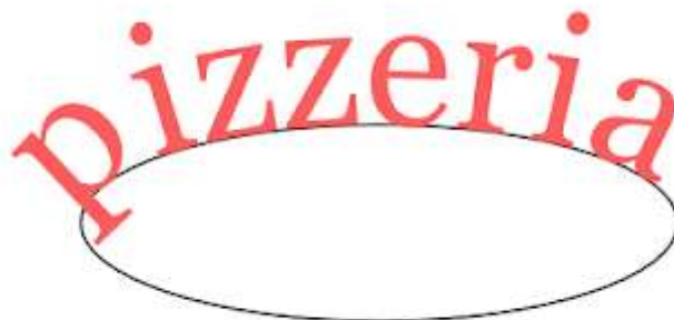
Obraz 1b. Napis dopasowany do ścieżki